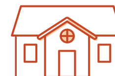
Fredet bygning udenfor kirkegård

Menighedsrådet kan selv tage stilling til en række ting, se bagsiden.