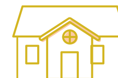
Ikke fredet bygning udenfor kirkegård